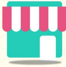
쿠폰을 들고 방문