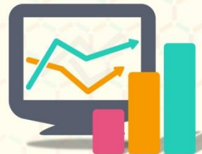
고객 늘고! 매출 늘고!